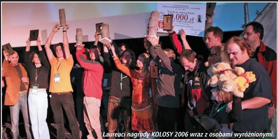
Laureaci nagrody KOŁOSY 2006 wraz z osobami wyróżnionymi.