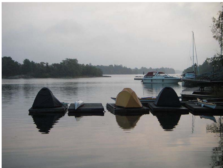
Biwakować można też na wodzie – na pływających pomostach (wyspa Broken).