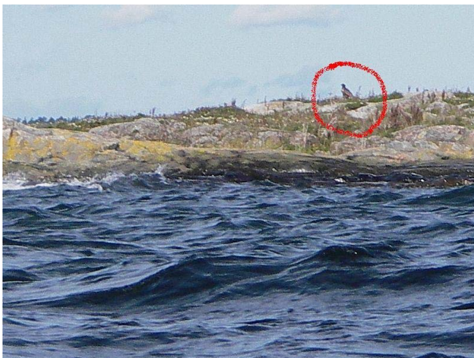
Na wyspie Kallhamn udaje nam się dostrzec orła. Niestety z kajaka trudno zrobić ostre zdjęcie.