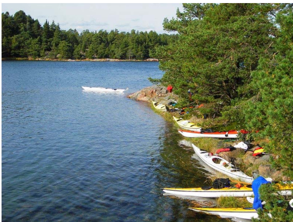
Urokliwe wysepki i zatoki Rezerwatu Przyrody Stendorrens.