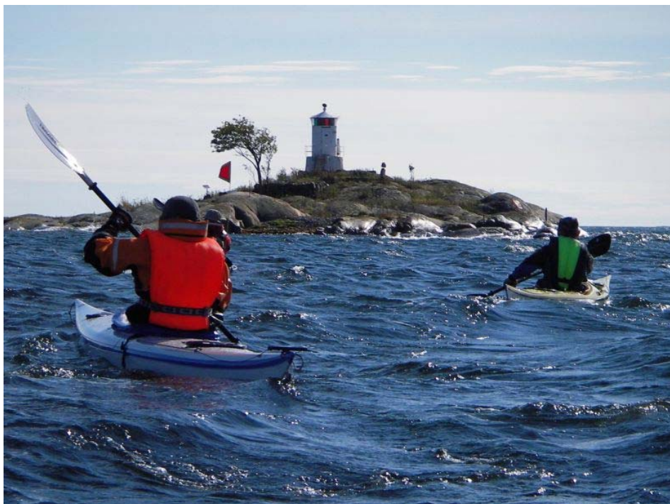
Przeływamy obok malowniczej latarni morskiej na wyspie Ledskar.