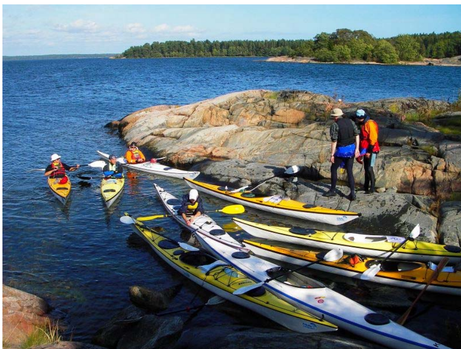
Odpoczynek przed cross'em z wyspy Granholmen na Krampo.