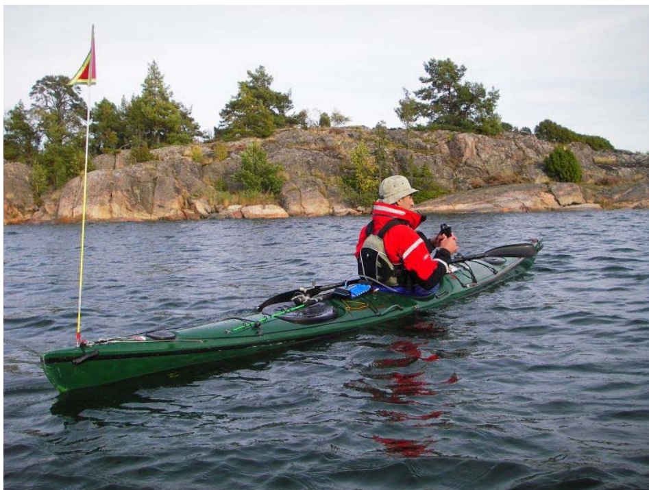
W drodze na wyspę Ringson.