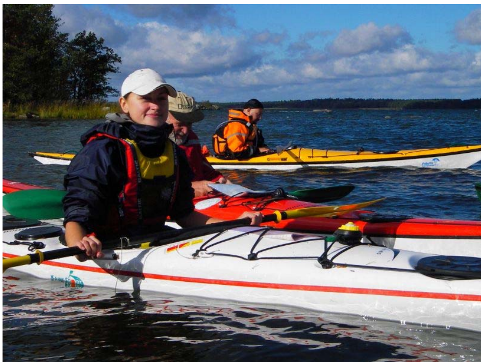
Po pierwszym noclegu na wyspie Tarnsholmen udajemy się na wschód.