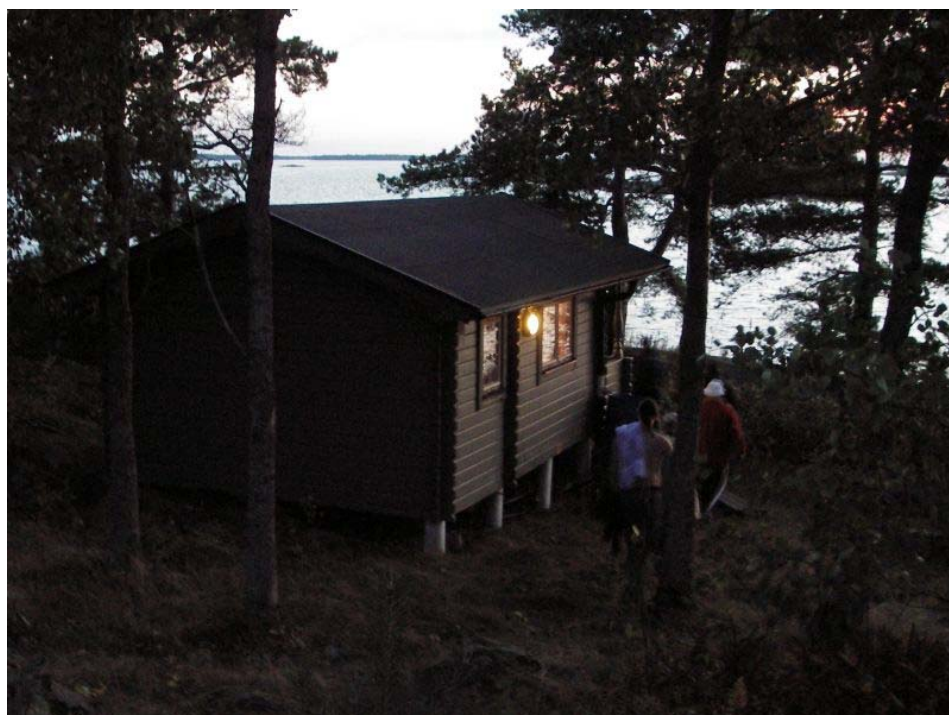
Na wyspie Broken skorzystaliśmy z sauny położonej nad brzegiem morza.