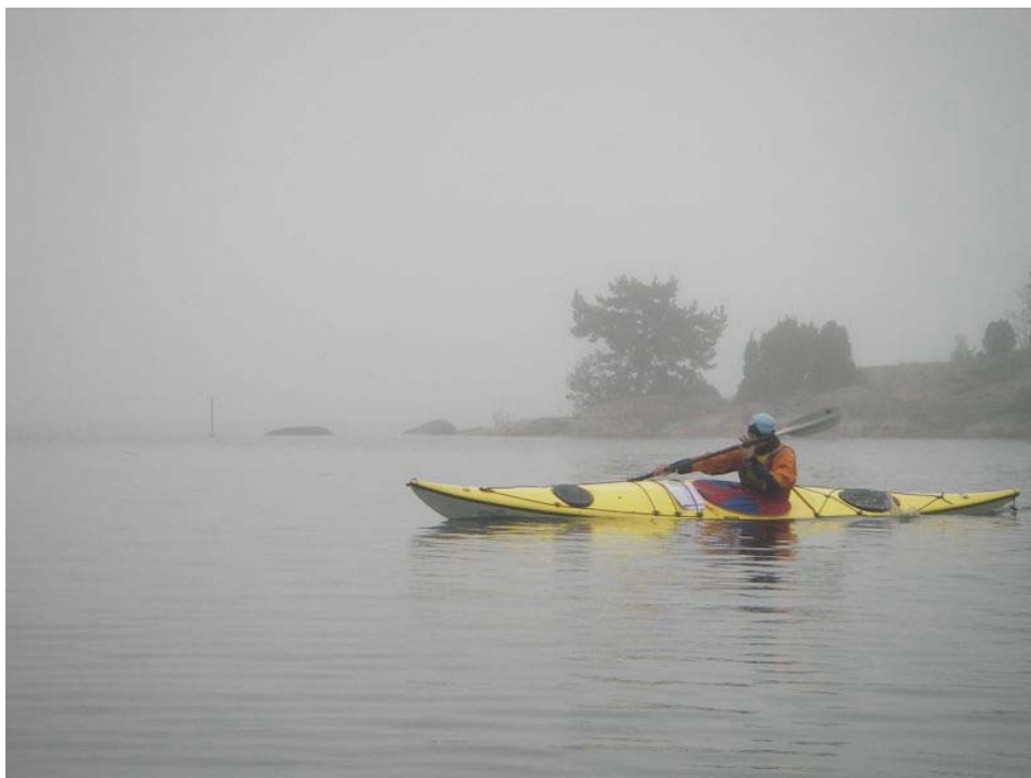
Na szkiecach należy być również przygotowanym do nawigacji we mgle (wypłynięcie z wyspy Broken na zachód – ostatni etap wyprawy).