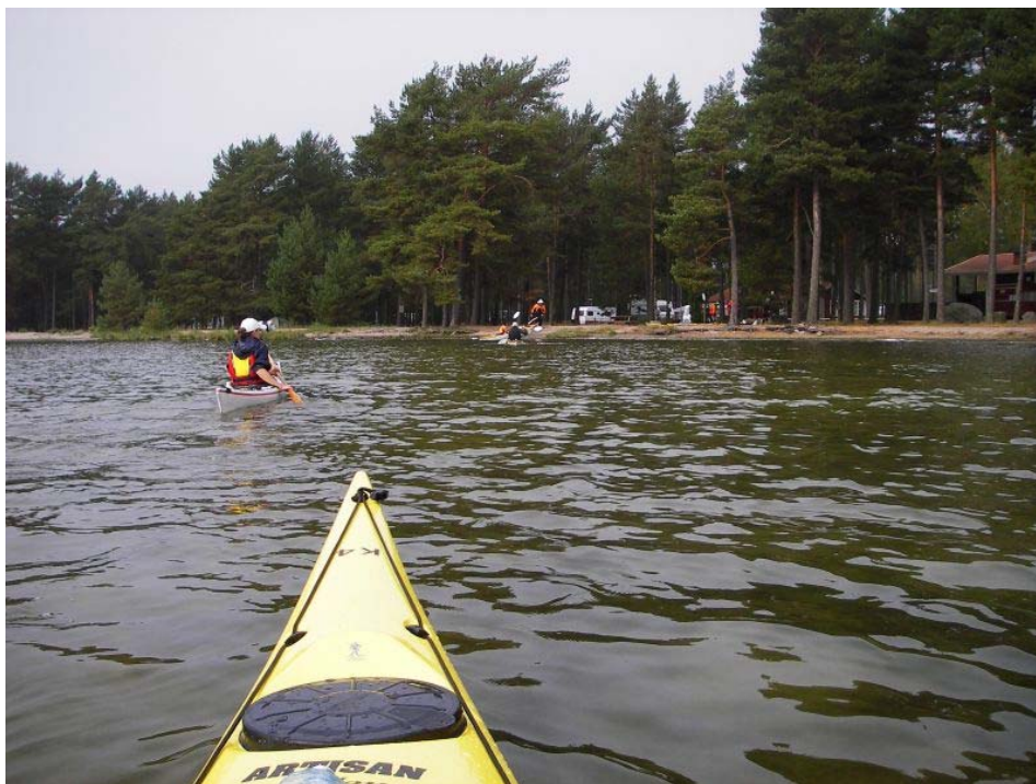
Zamknięcie pętli – powrót na camping Strandstuviken.