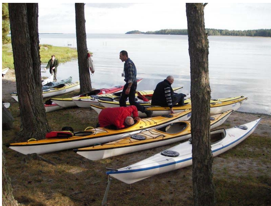
Miejsce startu i mety splywu – camping Strandstuviken. Najpierw będziemy płynąć przez widoczną w głębi Zatokę Strandstuviken.