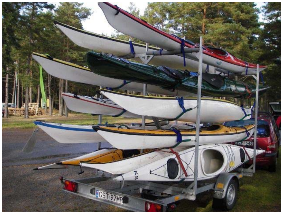
Kajaki morskie przywiezione na camping Strandstuviken.