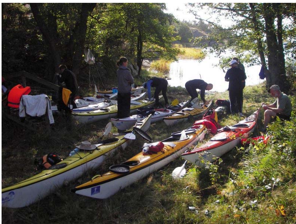
Nocleg na wyspie Lacka.