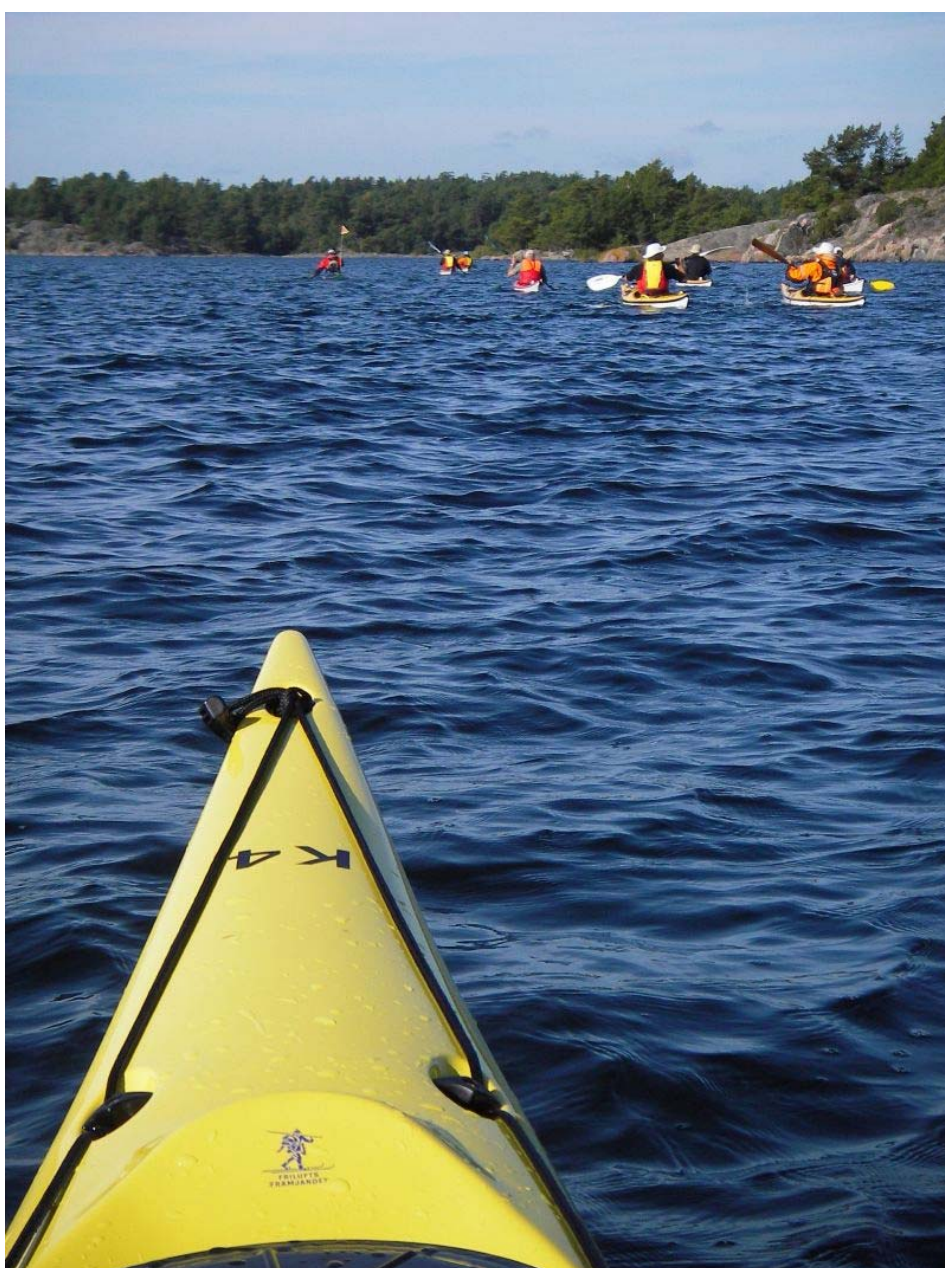
Płyniemy już na zachód w stronę wyspy Langon.