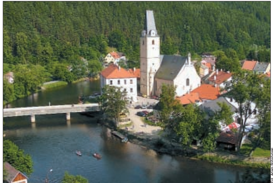
Widok z zamku w Rozmberku.

Ci, którzy nie mieli własnego sprzętu, pobierali go z wypożyczalni w pobliżu kempingu. Nawiasem mówiąc, wypożyczalnie na Wełtawie są doskonale zorganizowane, oferują głównie sprzęt polietylenowy (rzecz u nas prawie nie spotykana) i rafty, a także regularny transport osobowo-bagażowy wzdłuż Wełtawy, z którego za opłatą może korzystać każdy chętny. Nie trzeba przy tym opłacać całego kosztu trans-