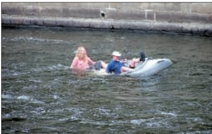
Vodacy pokonani przez jaz w Czeskim Krumlovie.