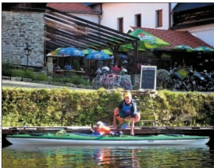
Na kajakarzy czekają liczne knajpki nad samą rzeką.

Ale może zacząć od początku. Płynąc z biegiem Wełtawy mijamy po kolei: